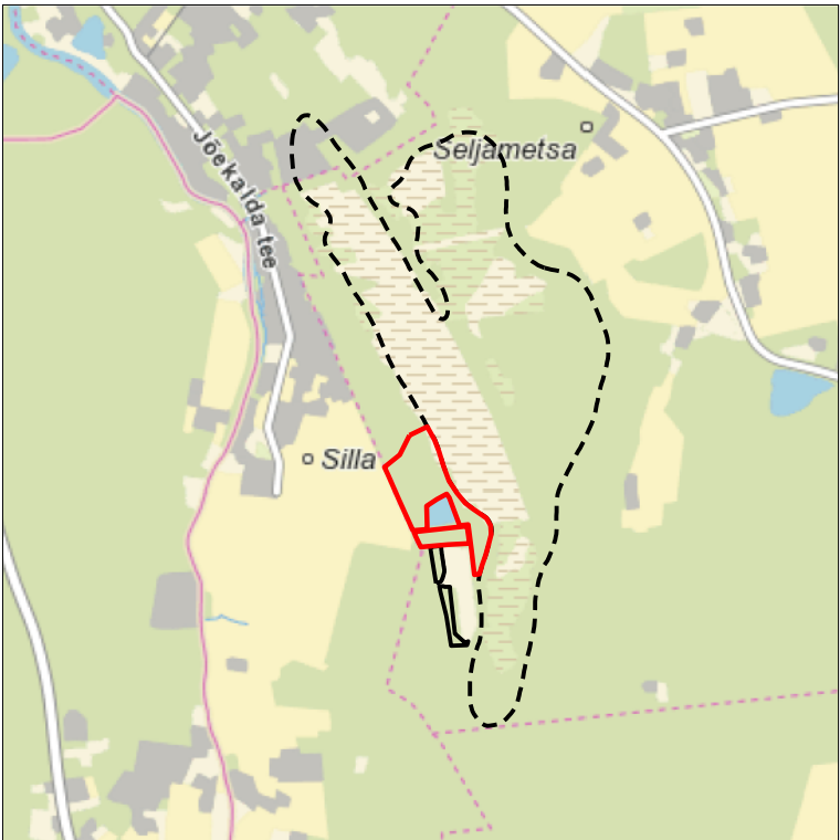
Kaardileht nr 5332 Pärnu